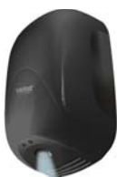
nero opaco (NF)